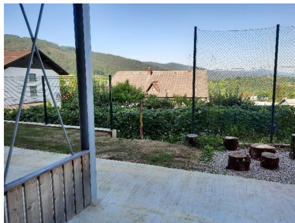
Fotografija 8: nedokončana ograja