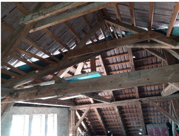
Fotografija 5: vdor vode, neizolirano podstrešje