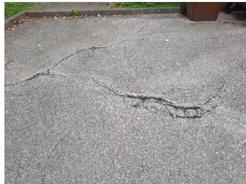
Fotografija 4: poškodba na asfaltu med EKO otokom in igriščem