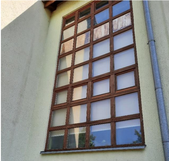
Fotografija 12: vdor vode zaradi preperelega okenskega okvirja