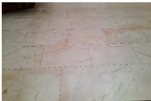
Fotografija 11: posledice vdora vode zaradi slabega tesnenja ob stikih PVC plošč