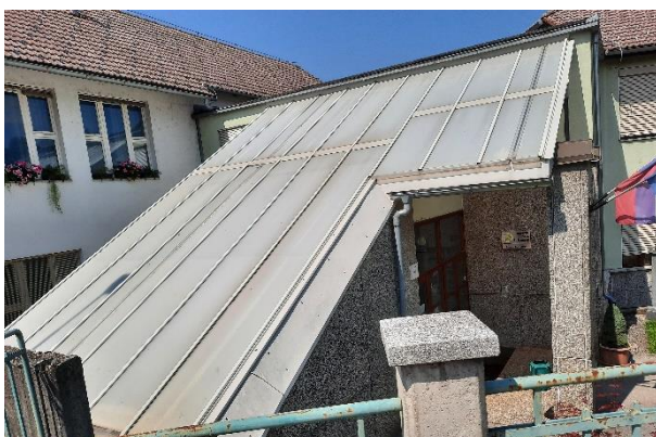
Fotografija 10: PVC streha nad zbirko znanih Suhokranjcev