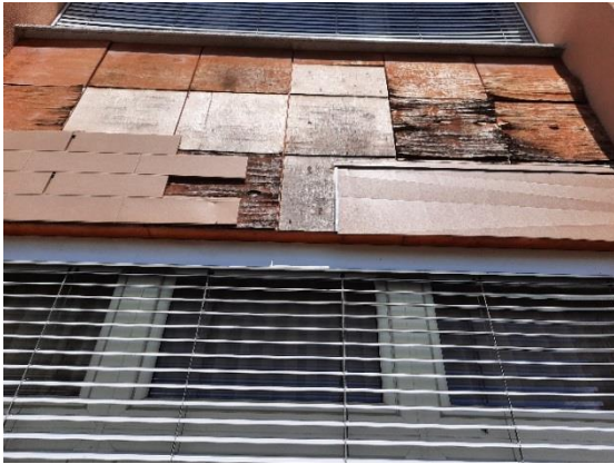
Fotografija 1: poškodbe na fasadi