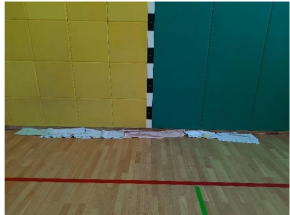
Fotografija 2: voda v telovadnici