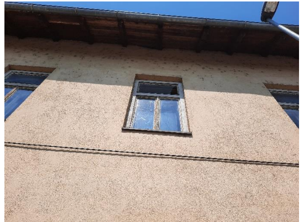
Fotografija 13: razbita stekla na oknih stare šole