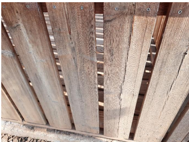
Fotografija 7: razpoke na ograji