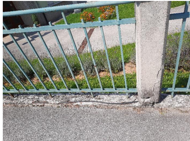
Fotografija 15: razkrita električna napeljava