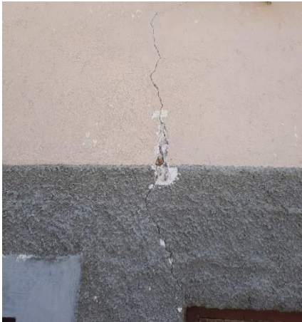
Fotografija 14: razpokane stene na stari šoli