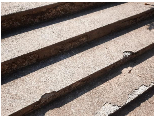
Fotografija 16: poškodovane stopnice pri vstopu na igrišče