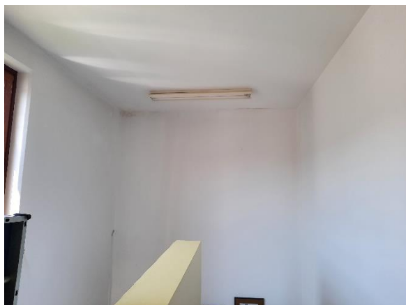
Fotografija 18: posledice vdora vode na stopnišču (glavni vhod v telovadnico)