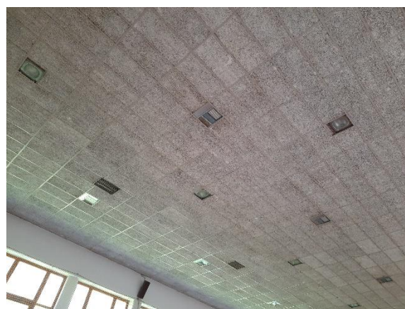
Fotografija 19: posledice vdora vode v telovadnici