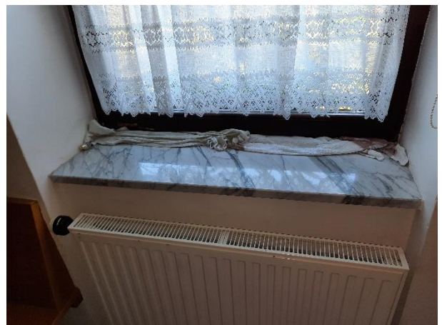
Fotografija 6: vdor vode ob nalivih