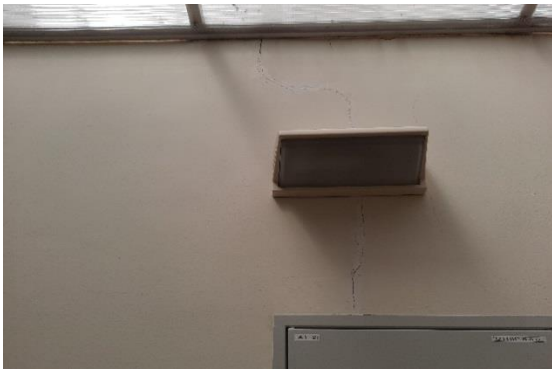
Fotografija 3: razpoke v steni na hodniku pred telovadnico