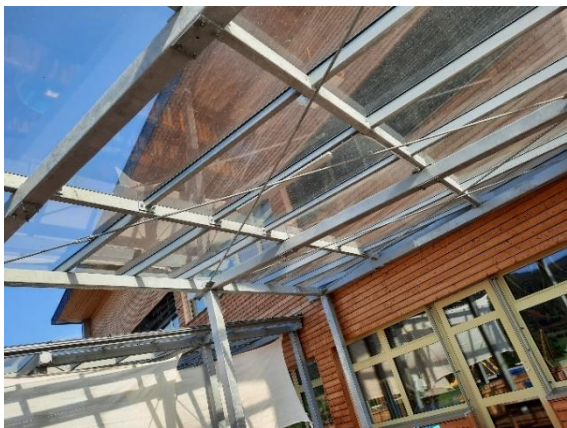
Fotografija 9: nezasenčena igralna površina