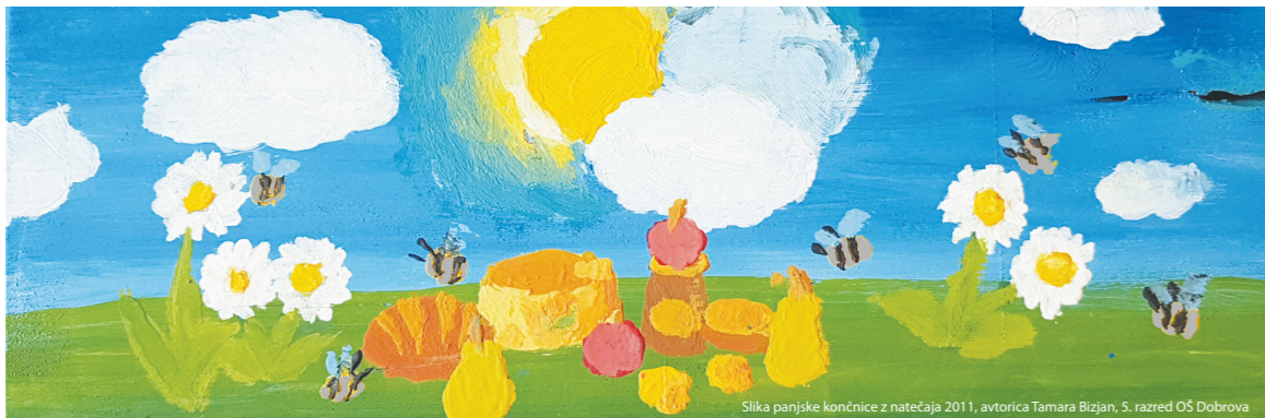
Slika pajske končnice z natečaja 2011, avtorica Tamara Bizjan, 5. razred OŠ Dobrova