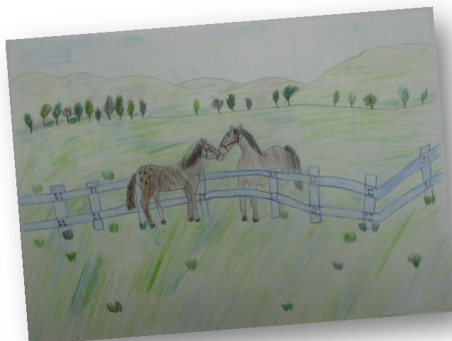
Polona Meglen, 7. a