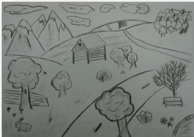
Vesna Zarabec, 8. a