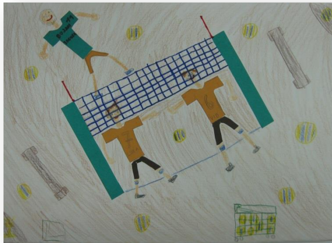
Vid Urbančič, 4. r.