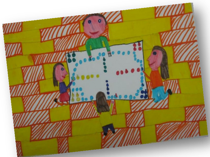
Teja Štravs, 4. r. PŠ Dvor