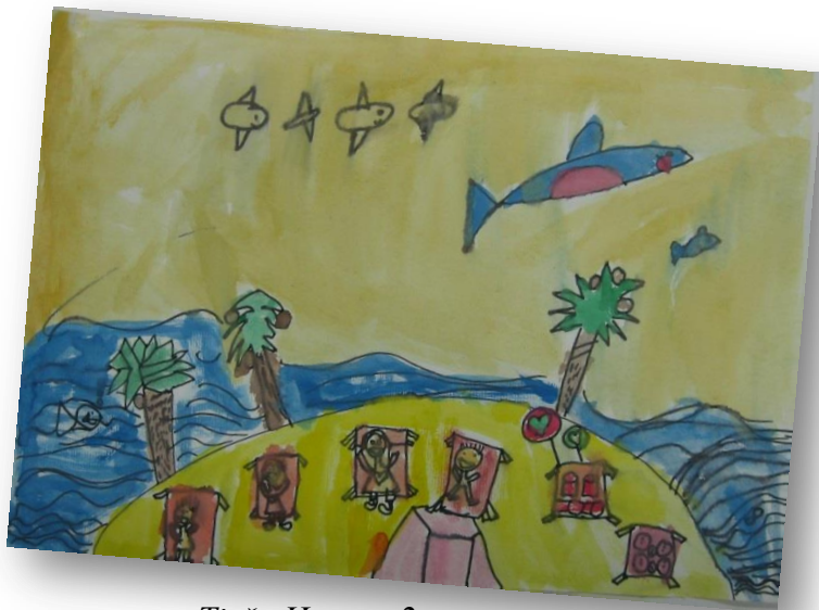
Tjaša Hrovat, 2. r.