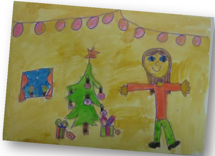
Katjuša Plot, 2. r.