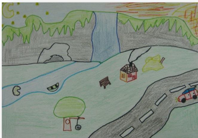
Nejc Muhič, 6. b