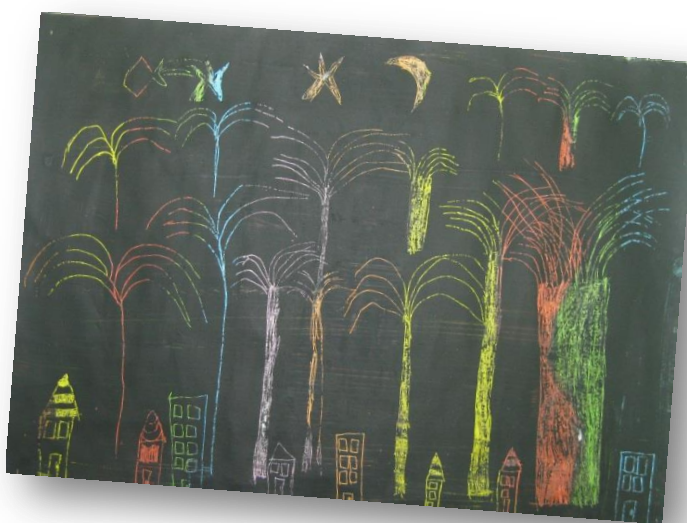
Nejc Miklavčič, 2. r. ŠPŠ Šmihel