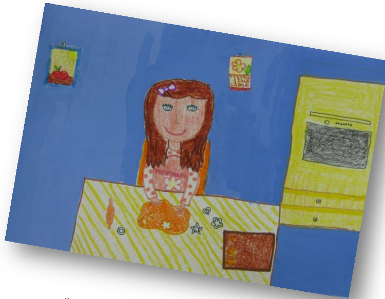
Ula Črnagoj, 5. b