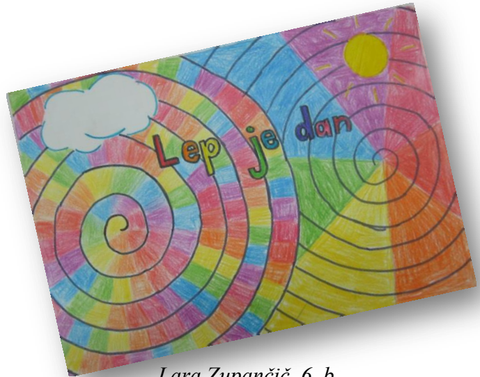
Lara Zupančič, 6. b