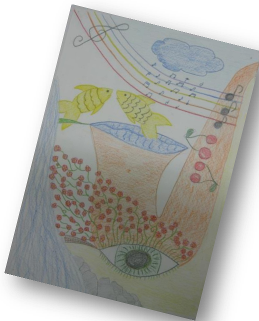
Vita Hren, 9. a