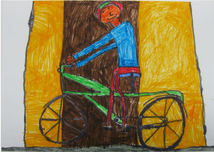
Žiga Štupar, 4. r PŠ Dvor