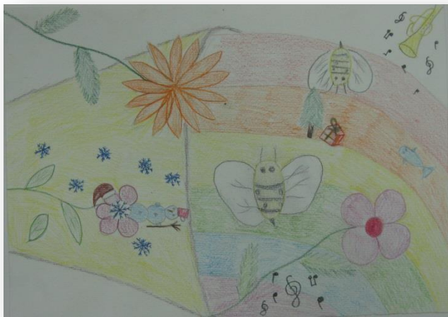
Ula Hrovat, 9. b