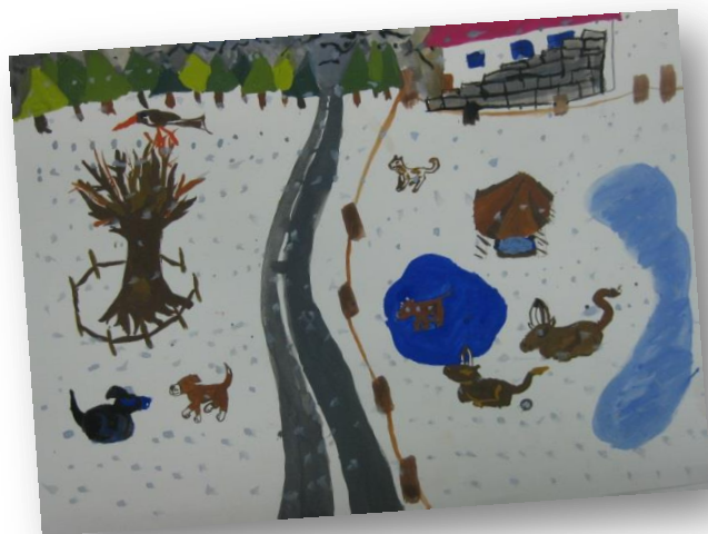
Teja Skledar Hudoklin, 5. b