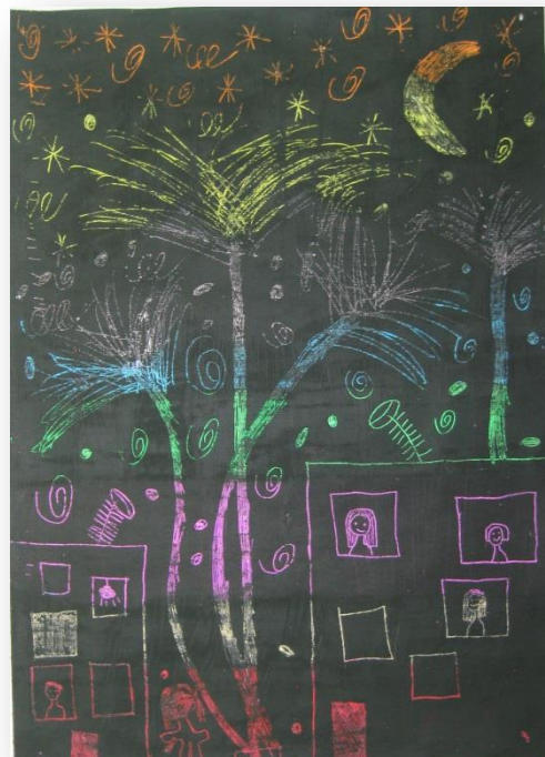
Klara Pograjc, 4. r. PŠ Šmihel