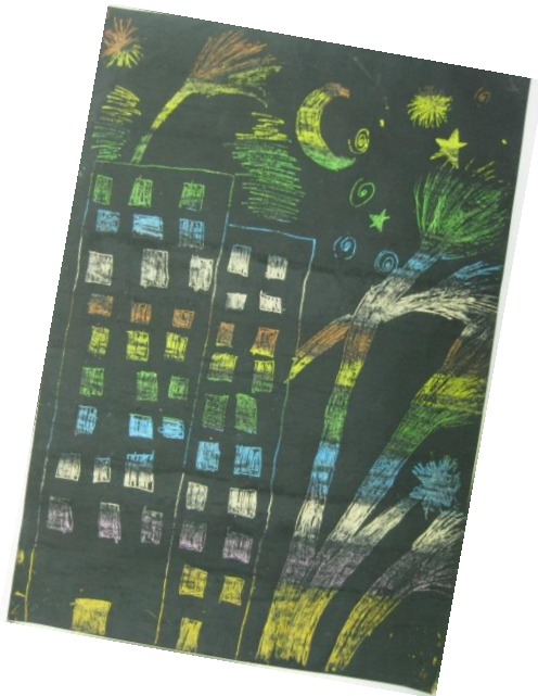
Vid Struna, 4. r. PŠ Šmihel