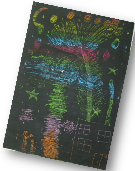
Žan Zaletelj, 4. r. PŠ Šmihel