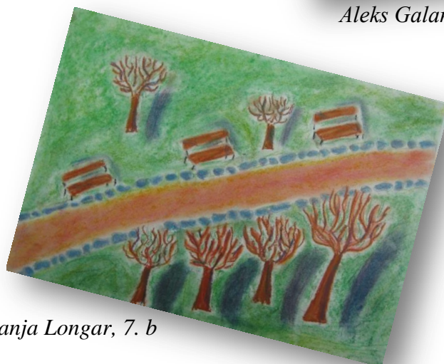
Janja Longar, 7. b