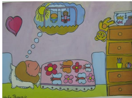
Maša Pogrjac, 5. a