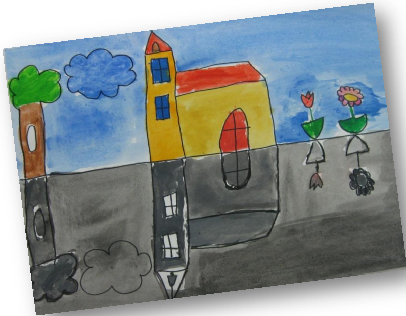
Neža Skube, 3. r. PŠ Ajdovec