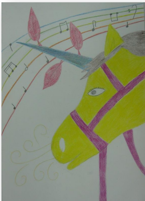
Tjaša Pestotnik, 9. b