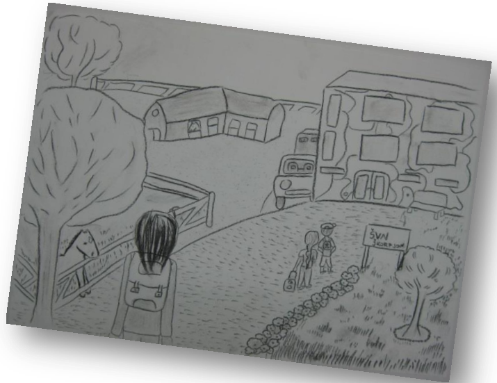
Živa Lavrič, 8. b