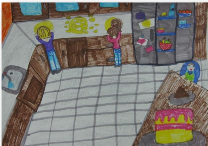
Julija Papež, 5. b