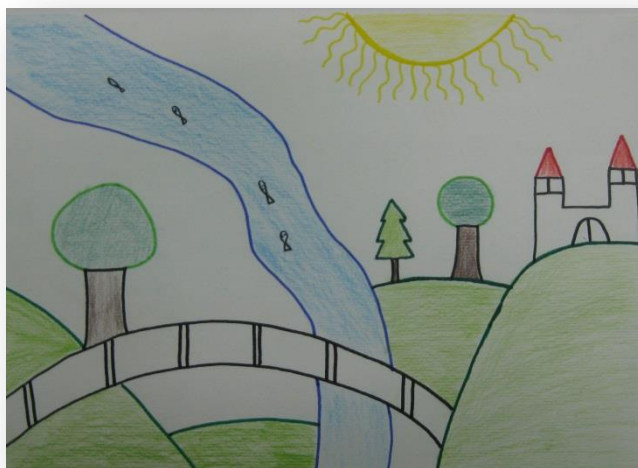
Žan Mravljak, 6. b