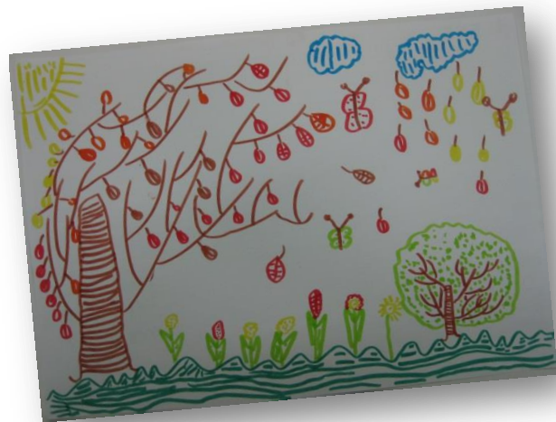
Aleks Galamič, 2. r. PŠ Dvor