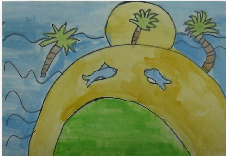
Žana Hrovat, 2. r.

Lepo oceno dobiš, ker pridno se učiš. Z družino se igraš, ker rad jih imaš.